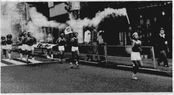
日光小児童の交通安全の火リレー