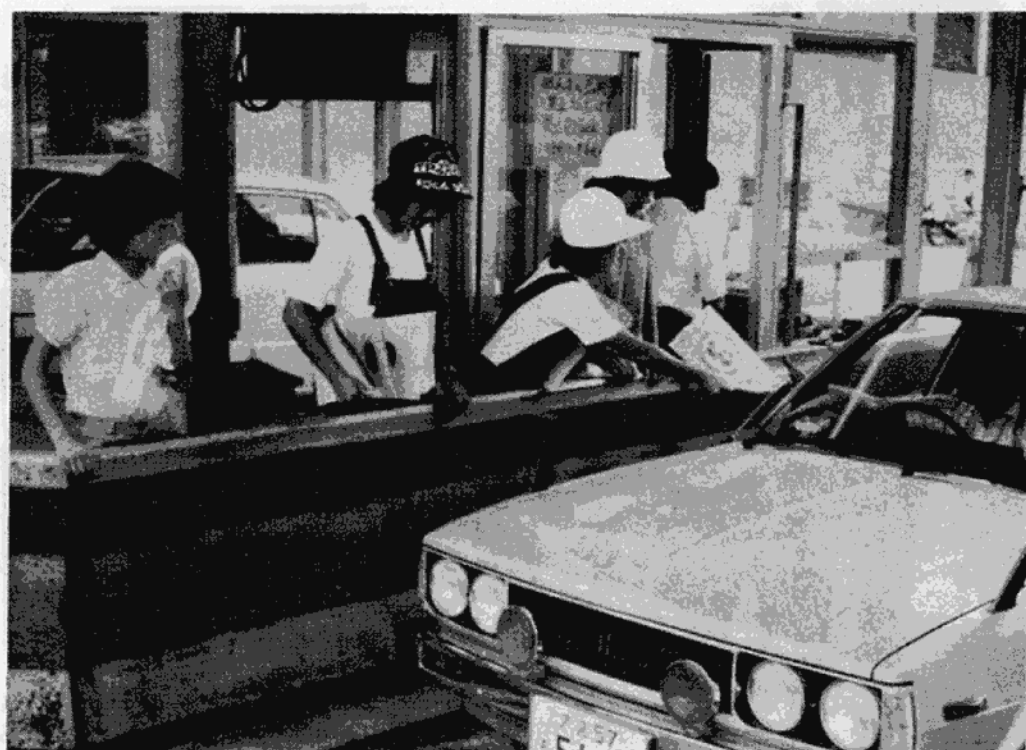
▲ゲートでゴミ袋配り

安良沢町の小中学生 夏の行楽シーズンの八月十四日と秋のもみじ狩りで賑う十月十日に、細尾地区の中学生約三十人と安良沢町子供会の会員約四十人は「ゴミの持ち帰り運動」を行いました。 細尾地区の中学生約三十人は、八月十四日、いろは坂有料道路ゲートで、中禅寺、湯元方面に向う観光客にゴミ袋を配り、「クリーン日光とゴミの持ち帰り」を呼びかけました。 また、十月十日には安良沢町子供会の会員約四十人が割山で、午前中は観光客にゴミの袋を配り、午後は、疲れて帰るドライバーにおしぼりの貸出しサービスを行い、気をつけてお帰りください」と一人ひとりに安全運転を呼びかけました。