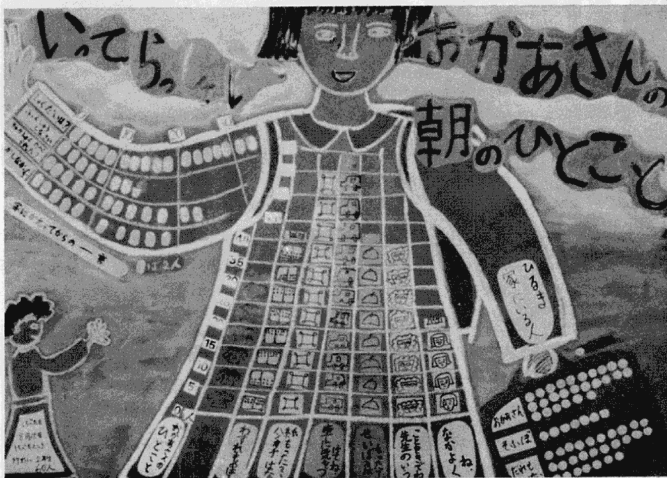
▲特選になった「いつてらっしゃい おかあさんの朝のひとこと」