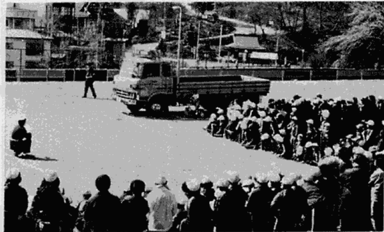
日光小学校の実験

大型車と人形をつかったこの実験を見た児童は、事故のこわさにおどろいていました。警察官の「大型車の近くで遊ばないように……」という話に真剣に聞き入っていました。