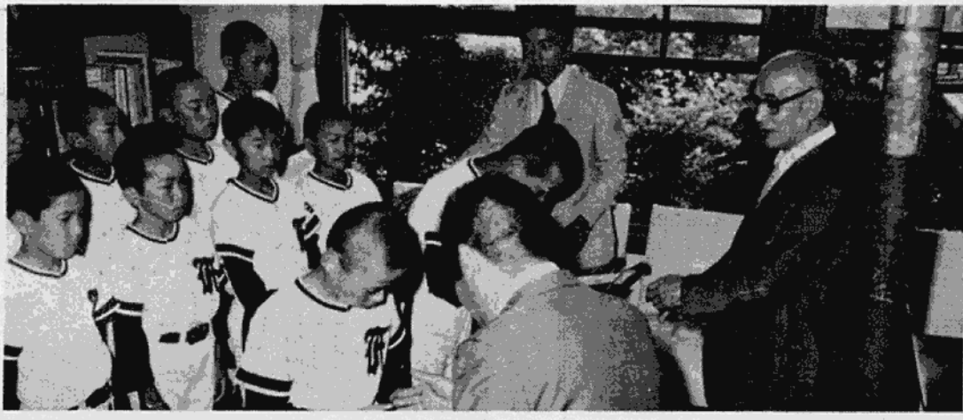
市長と議長から激励される選手たち