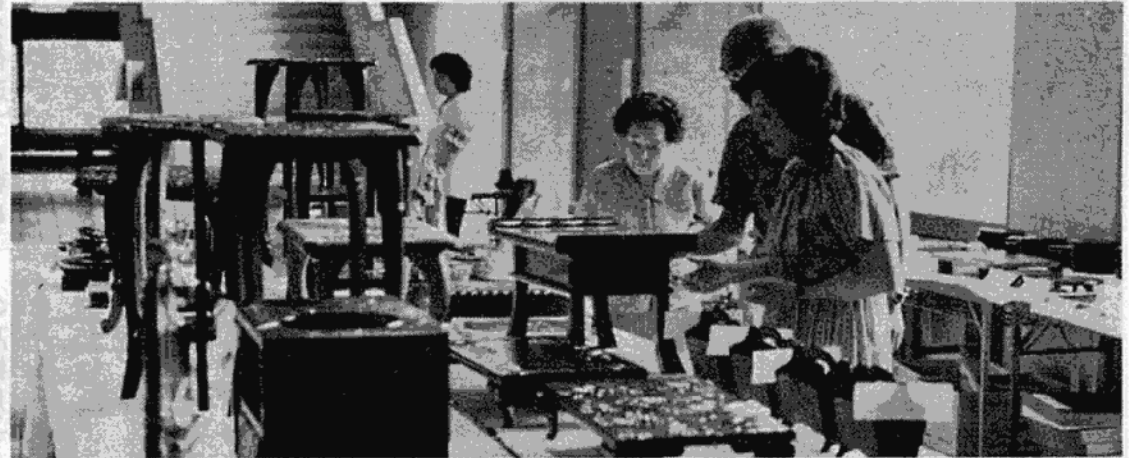
特産品展示即売会

光和楽踊り」は、初日がいにくの雨でしたが、それでも二日間で六千五百人が夏の夜を楽しみながら踊りの輪を広げました。 「男体山登拝大祭」関係の諸行事には一万四千人。「精銅所和楽踊り」は、二日間で五万人もの人が集まりました。 「立木観音夏まつり」と、今年新たに加わった「湯の花音頭まつ