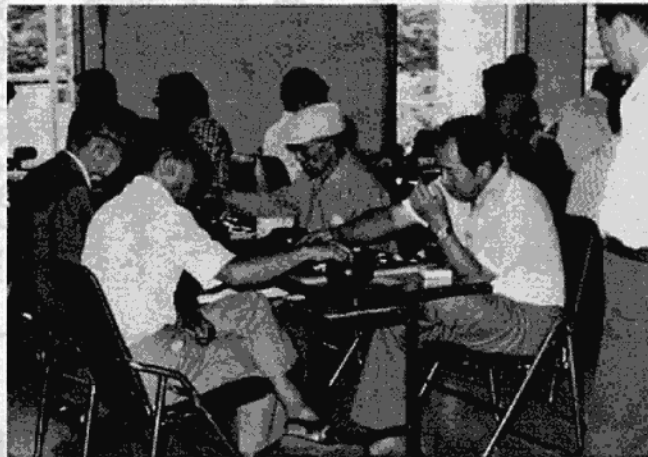
①日光和楽踊り ②納涼囲碁大会

り」は、地元の人たちの協力で盛り上がりを見せ、また、「大谷川釣り大会」と「湯ノ湖釣り大会」には、延べ四百人の大公望が腕を競い合いました。 東京青少年吹奏楽団と市内小中学生による「演奏会」には、今年新たに所野小学校が参加、熱の入った演奏会となり、また、子供たちが楽しみにしていた「チビッ子