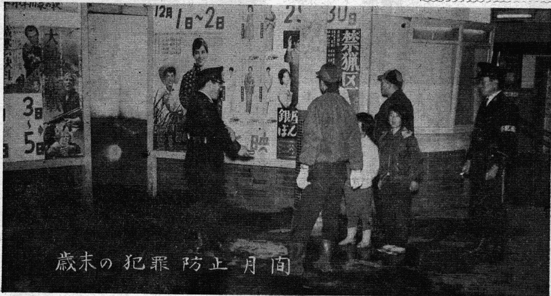
歳末の犯罪防止月間