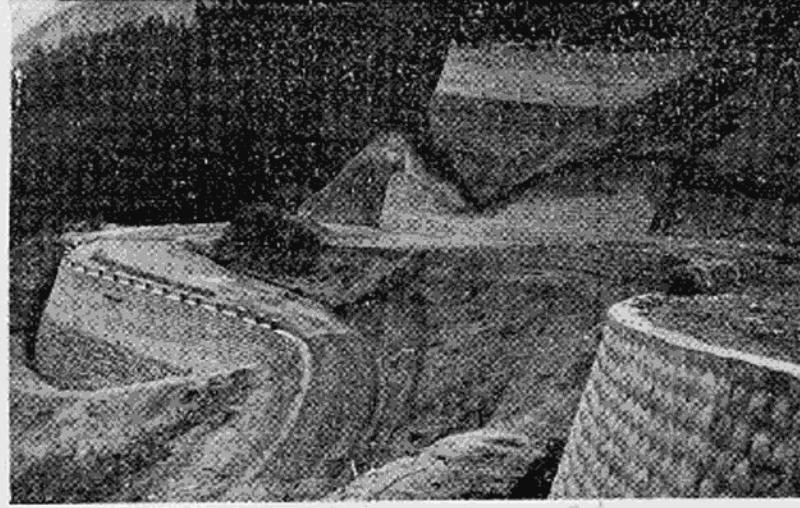
(昨近くではブロックの特殊石積がされている)

合併時の条件の一つであり、また新市町村建設実施計画の一つでもあった和の代、滝ヶ原間の「和の代林道」が、このほど完成した。新市内の連絡道路として、また産業道路としての、この道路がはたす役割は大変大きい。完工式はまだ終っていないが、その工事のあらましを、ながめてみよう。