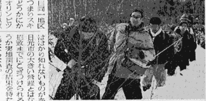
深いやぶの中を進む山岳班

昭和38年開かれる第10回オリンピック冬季競技大会を日本に招致しようという目的で、全国的に立候補地を募集している。