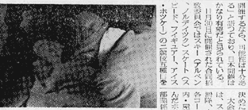
吹雪の中での苦闘 第一次実地調査終る

今年四月から具体的な方向に動き出した、身体障害者雇用促進法によりによる「からだの不自由な人を職場に受け入れる」運動を行なうことになった。