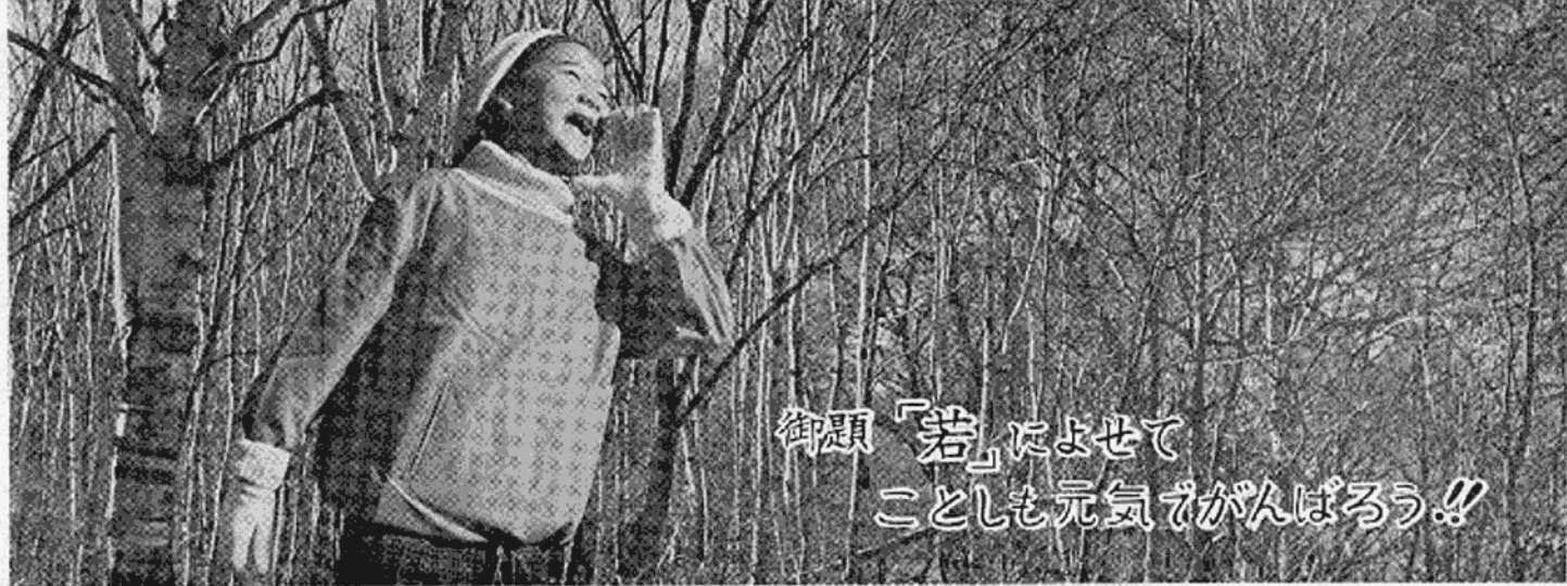
御題「若」によせて ことしも元気でがんばろう!!

しかしながら、複雑な現代社会で、二十歳の青年に与えられる生活は前屈である。経済的自立のできる青年は多くはない。職業も定まらぬ