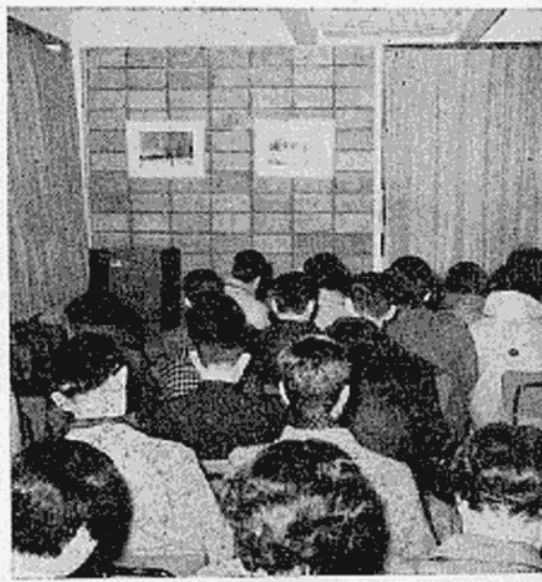
(第一回ステレオコンサートより)

活用されているユースホステル 月に一回ステレオ・コンサート実施 昨年八月開所した日光ユースホステルは、その設備の豪華さを高く買われて内外の来客者に広く利用されているが、更に市民にも大いに利用してもらおうと、月に一回ステレオ・コンサートを開くことになった。第一回は一月二十四日、一時から開き、「春の祭典」「大序曲一八二二年」「イタリヤ奇想曲」「スラブ行進曲」「ヨーロッパのムード集」など、約四時間わたつて、クラシック、ポピュラーを