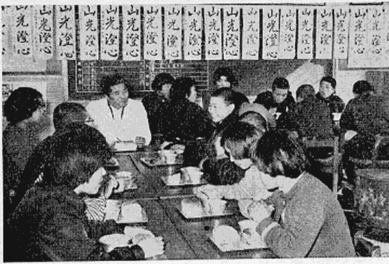
先生を囲んで楽しい給食のひとつ