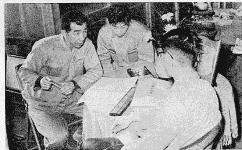
市民のために活躍する人々 (6)

り、工場を訪ねたり、或いは商店を訪ねたり、地味な調査に活躍している人々がある。それが「統計調査員」だ。統計調査員は、国勢調査、農林業センサスなどの国の統計に従事する場合に、市長の推せん、総務大臣から任命される。又市の独自統計の場合には市長が直接任命して、従事してもらおう。