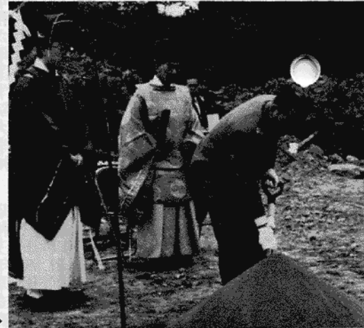
環境豊かな住宅地の建設を目指し、七里土地区画整理事業の起工式が十月九日に行われました。同区画整理事業は、昭和五十一年に計画立案されてから八年目にして着工の運びとなったものです。

ををお願いします。平和を満喫できる今の日本を考えるにつけ、残留孤児の肉親捜しや、アフリカの飢餓の問題を見聞する度に多くの問題があることを認識させられます。こうした時こそ、あるグループで呼ばれている「素直さを取りもどそう」「やさしさを見直そう」との必要性を感じさせられる今日です。（題字「寸描」は齋藤市長）