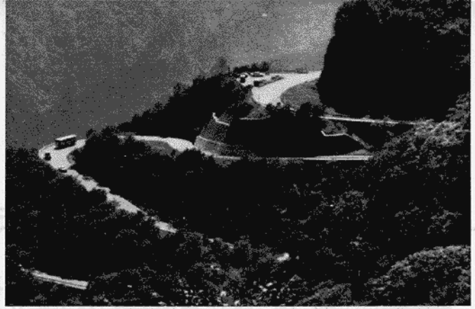
日光の観光名所の一つとなっている日光道路（通称いろは坂）が、30年間の料金徴収期間を終え、10月1日から無料解放されました。