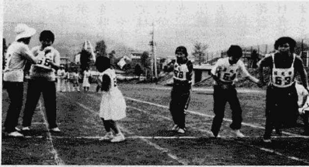
▶ 昨年の心身障害者スポーツ大会（日光小グラウンドで）

免除申請は、毎年七月三十一日までに手続きをすることによって、その年の四月分から年度内の期間が免除されますので、忘れずに手続きをしてください。ただし、希望により任意加入した人は、免除は認められません。詳しいことは、市民課年金係（☎五四一一一一内線一二五）へお問い合わせください。