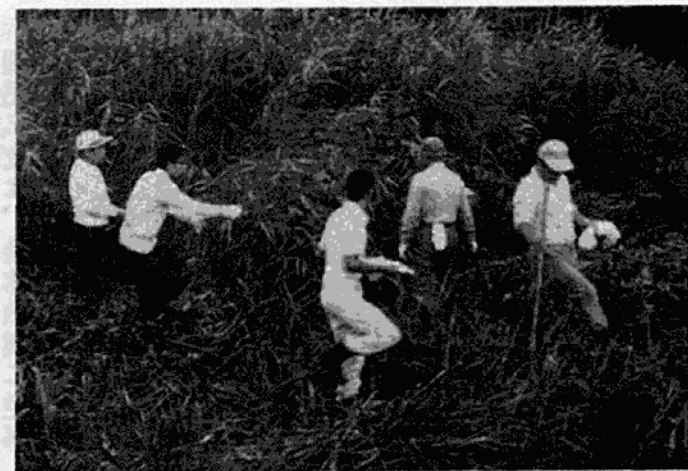
清掃活動に励む市民

こうした河川の汚れをなくし、自分たちの手で美しい川を取り戻そうと、志渡淵川の流域にあたる御幸町・石屋町・松原町・相生町・東和町・若杉町・宝殿・七里の八