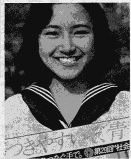
社会を明るくする運動

犯罪や非行のない明るい社会は、私たちの願いです。そこで私たち一人一人が犯罪や非行の防止と、一度つて罪を犯した人たちの更正についても理解を深め、それぞれの立場から力を出し合っつて明るい社会を築こうと、毎年全国的に展開されている運動、それが「社会を明るくする運動」です。