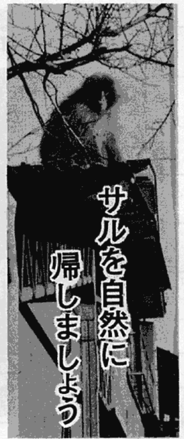
市役所近くに 現われたサル

ことしも、サルが人家の近くに現われて来ました。サルは、果実や田畑の農作物などを手あたりしだいに食い荒らし、人間に被害をあたえます。