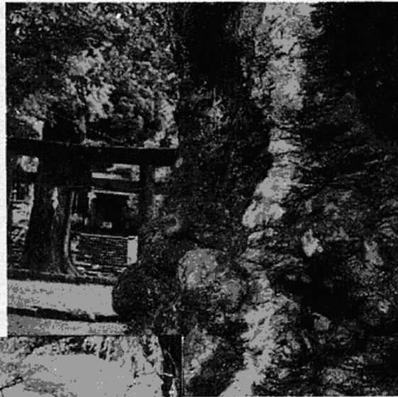
⑱ 花石神社 けやき