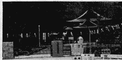
現在の天理教日 光大教会