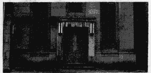
前の足利銀行日 光支店

相談の内容などについては、秘 密を守っています。電話や郵便で も受け付けています。お気軽にご 相談ください。