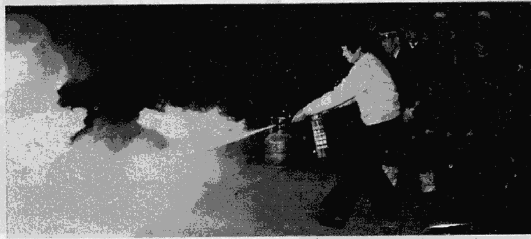
消火器の使い方訓練