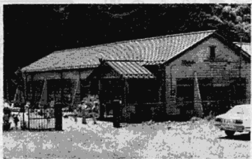
現在の精銅所清滝幼稚園