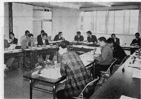
▶ 熱心な討議を展開する委員