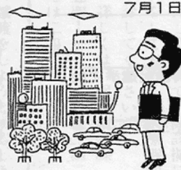
サービスマネジメント調査、事業所統計調査(調査票)