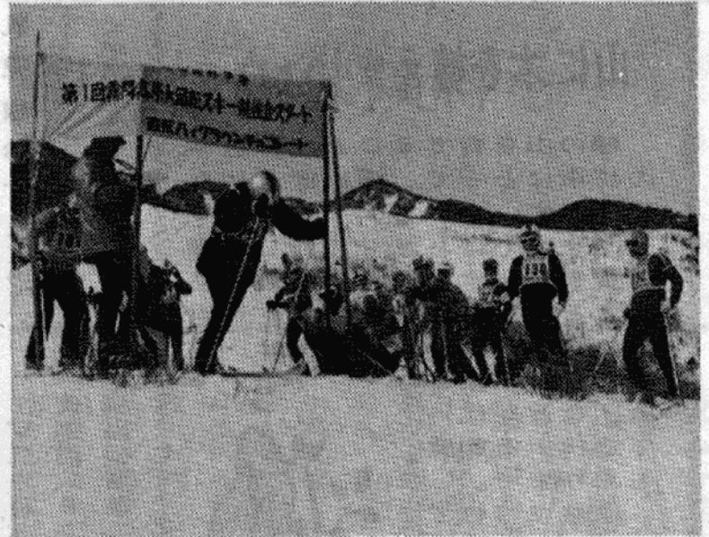
▲日光市長杯争奪の第1回霧降高原大回転スキー競技会が開かれました。(3月4日)