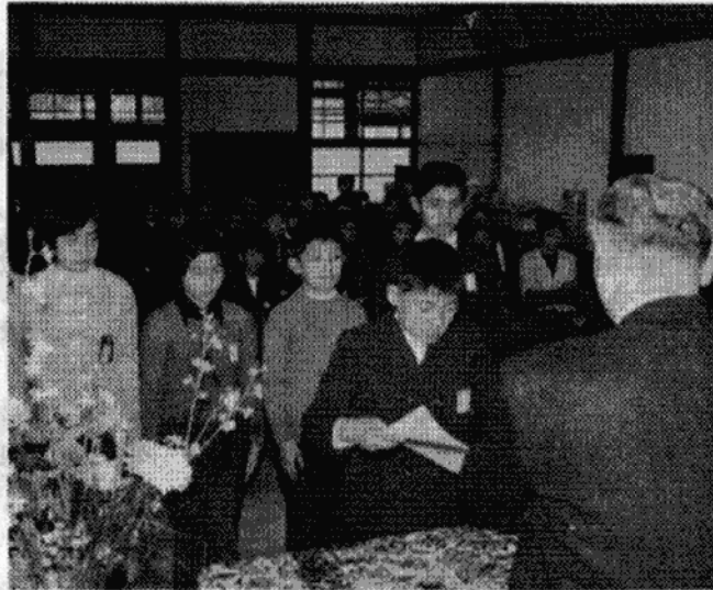
大会議室での表彰式

市と教育委員会が、三月十四日、市内の小・中学生のうちから、健康優良児など百九十八名の児童・生徒を表彰しました。 この表彰は、市内の小・中学生で、心身ともに健やかに育ち