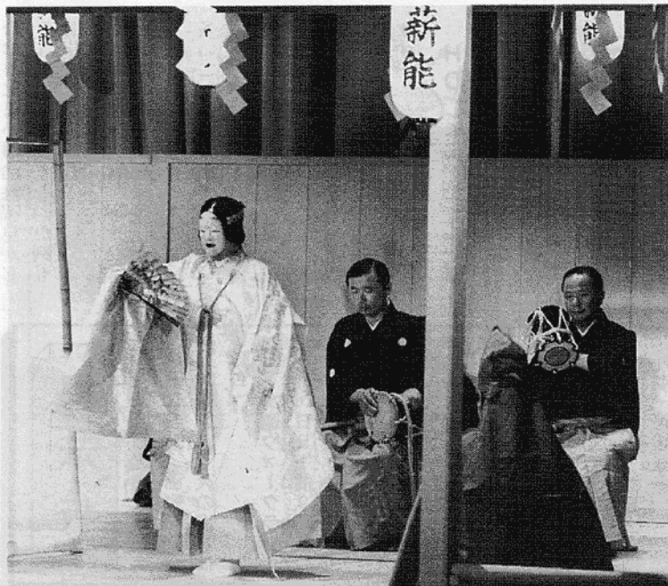
幽玄の世界に誘った薪能 現代の与一…扇的的弓道大会