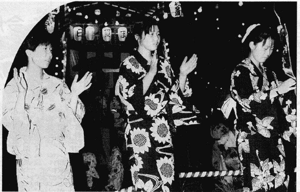
2日間で12,000人が楽しんだ＝日光和楽踊り

恒例の「日光納涼夏祭り」も、天候に恵まれ、8月12日・13日の日光和楽踊りを最後に、主催行事を全て終え、本紙発行までには、協賛行事であるウオーキング・イン・日光も閉幕し、日光の夏も終りを告げます。去り行く夏を忍び、多彩に繰り広げられた行事の数々を、カメラでひろったアルバムで綴りました。このアルバムの中に、もしかしてあなたも登場していませんか？