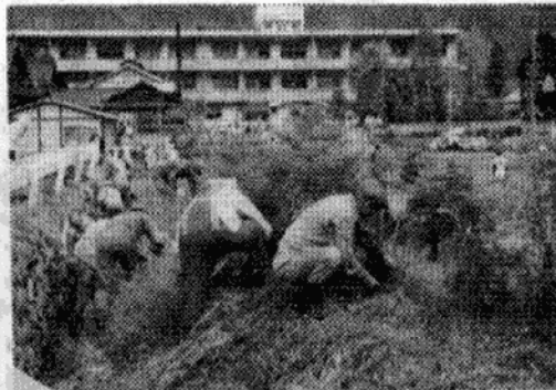
▲草刈りに精出すお年寄り

同会は、これまでもそうきんをぬって清滝小学校に贈るなどの奉仕活動が続けており、年はずっとも、少しでも社会の役に立ちたいと、元気に労力奉仕に励んでいます。