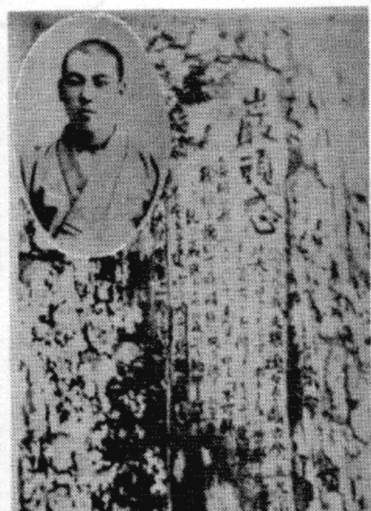
写真は樹に刻まれた巖頭之感の遺文と藤村操

既に巖頭に立つに及んで胸中何等の不安あるなし。始めて知る大なる悲観は大なる樂觀に一致するを