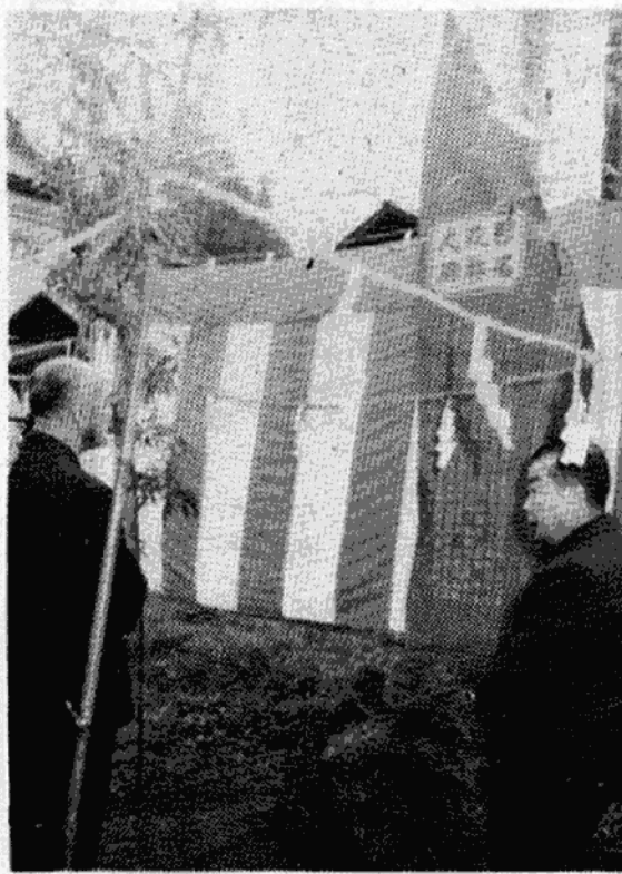
【写真は建立された記念碑】

昨年三月一日から住居表示が実施された西町地区では、これ名などについても、永く後世にを記念し、板挽町・大工町・袋 残しておこうと、西町自治連合 町・四軒町など、無くなった町