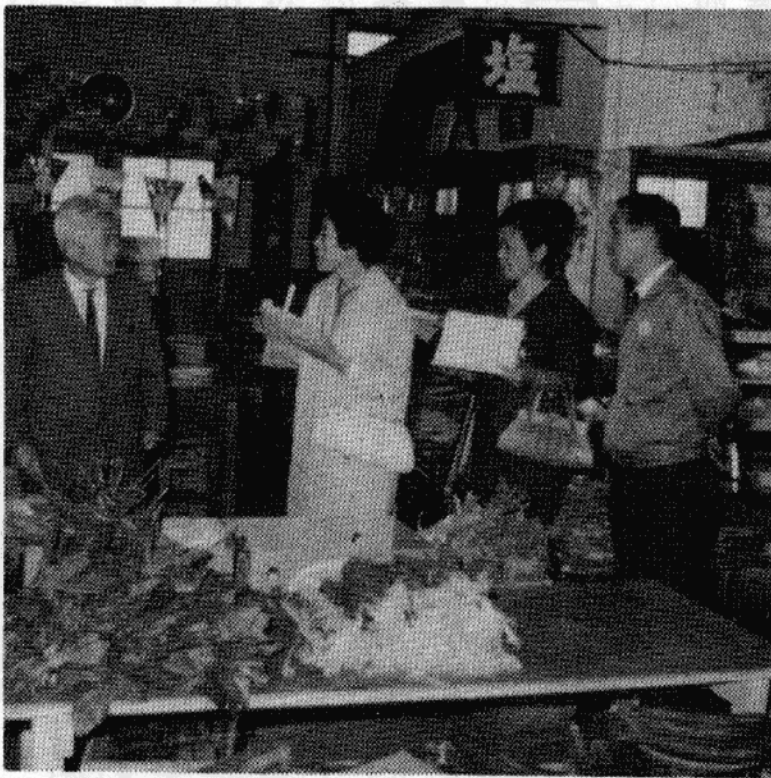
【写真は、消費者を代表して、きびしい目を光らせる監視員】

六月十六日、市と今市保健所 それに食品衛生協会らの共催で 市内の飲食店や肉屋さんなど、 食品を取り扱うお店の「一日監 視」が行なわれました。