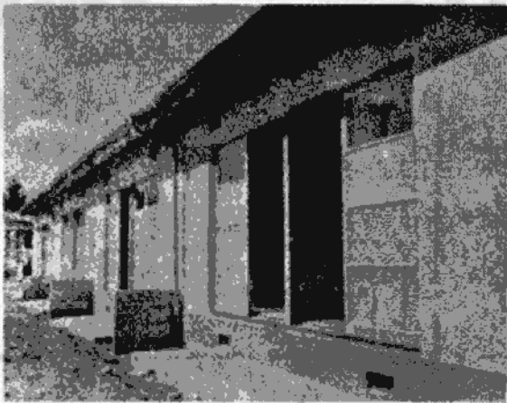
四十四年度に建設した広久保市営住宅に、まだ空屋があります