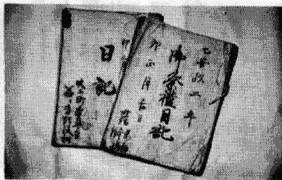
〔写真上は明治一七年当時の小学校卒業証書下は御祭礼日記〕