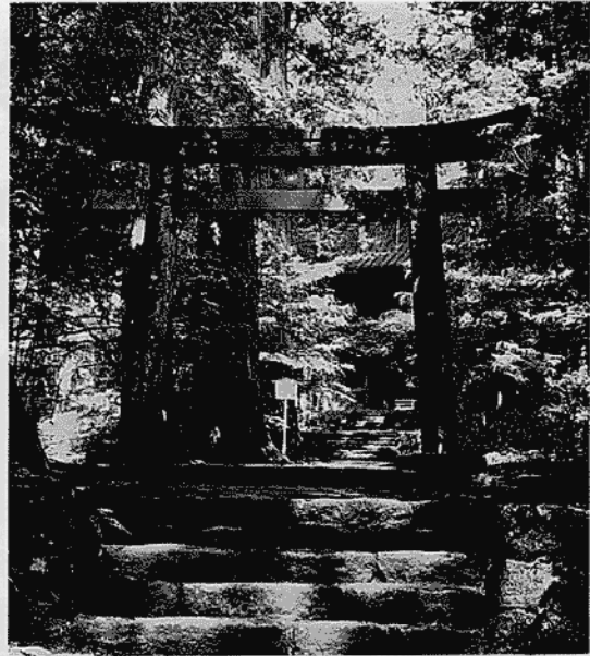
願いが叶うといわれる「運試しの鳥居」

参道桜門前にある石の鳥居。額束の真中に穴があり、この穴に小石を三つ投げて、うまく通ると、願いが叶うという。元禄二年(一六八九)三代家光の遺臣、梶定良の奉納。 ⑪ 滝尾神社 弘仁十一年(八二〇)弘法大師の創建。現在の建物(重要文化財)は、江戸初期のものだが、明治四年の神仏分離まで、桜門に大師筆の「女体中宮」の額があったという。