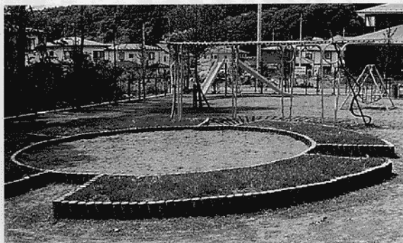
完成したやすらぎ児童公園