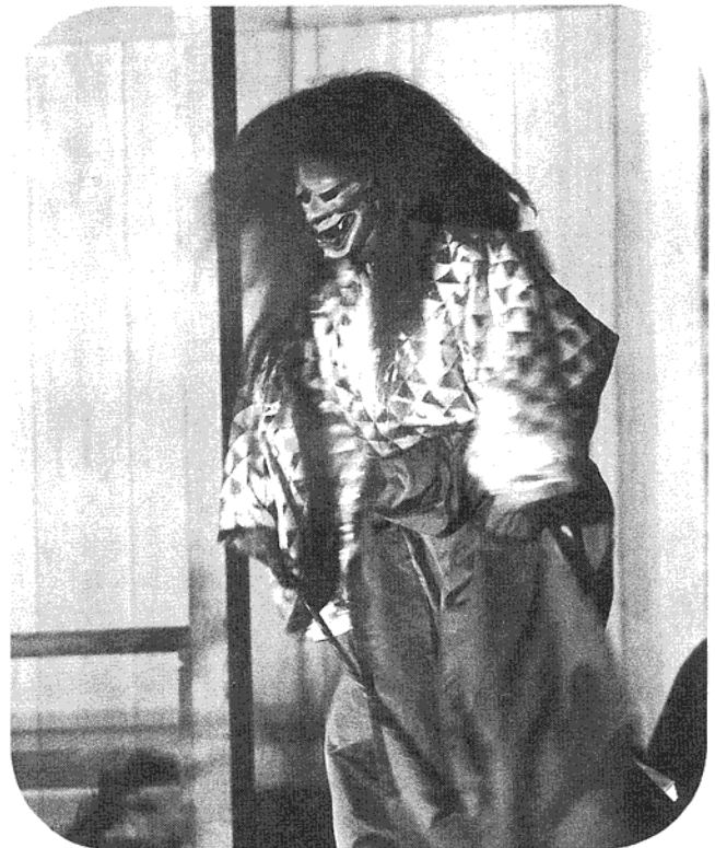
▼ 幽玄な世界に誘った新能