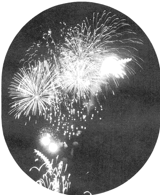
▼ 800人が感動したフリーウィー