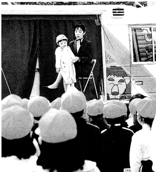
マロニエ号での腹話術