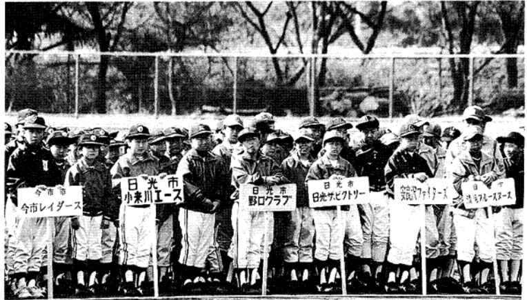
開会式での地元チーム