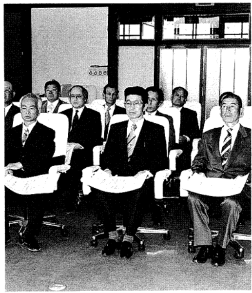
当選証書附与式のもよう