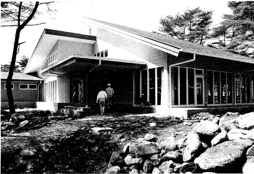
完成した所野運動公園管理事務所