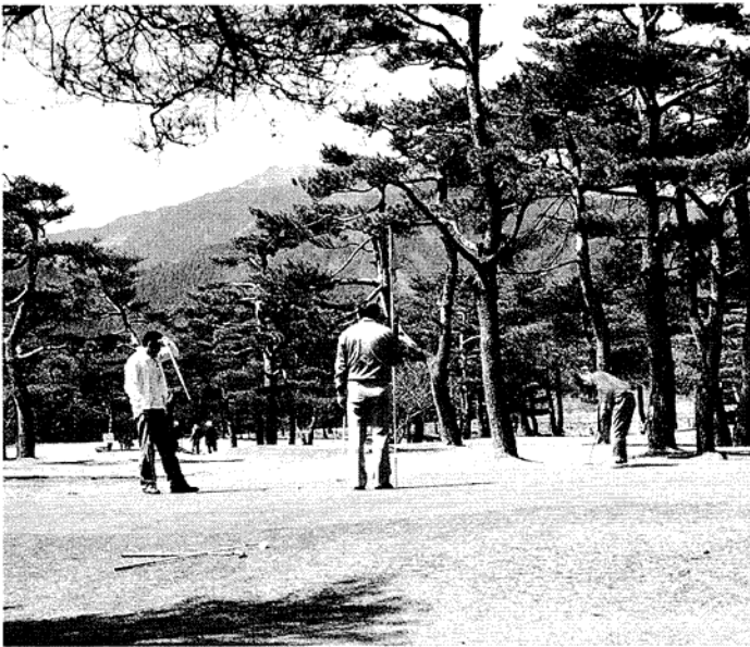
28年目を迎え、ますます人気の市民ゴルフ場