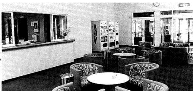
カウンターとゆったりくつろげそうなロビー

ロッカー室には、スチールロッカーと待ち望んでいたシャワーが二基設置されています。ゴルフに限らず、テニス、野球などで一汗かいたあとは、シャワーを浴びてさっぱりした気分が帰ることができると良いでしょう。健康管理に、憩いの場としてどしどしご利用ください。