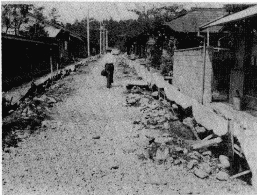
【舗装される袋町線】