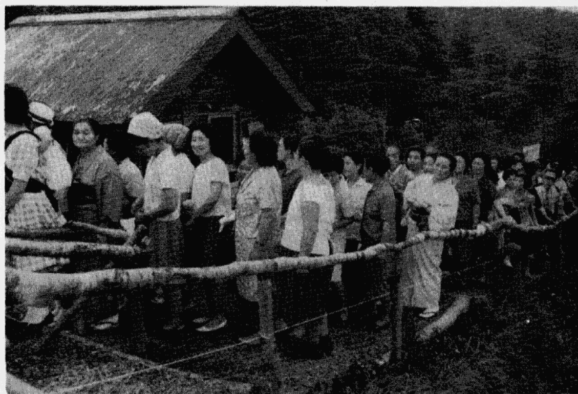
【霧降高原でキスゲを觀賞する見学者】

..... 昨年に引き続き施設広聴会を計画、六月二十六日から七月七日まで延五日間にわたって開催しましたが、昨年をはるかに上まわるご参加を得、好評のうちに施設広聴会が終わりました。