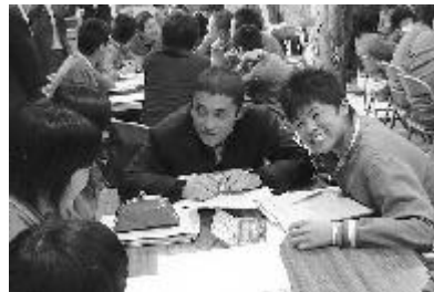
総合的な学習の時間