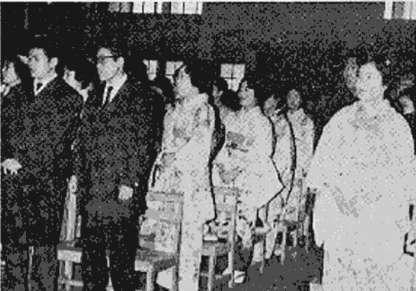
1月15日「成人の日」この日 はれて成人となった青年男女は 日光市で五百三十二人、「君が 代」の大合唱をうたい、成人と しての第一歩を、力強くふみ出 した。

「本日ここに第十三回の成人式 を挙行せられ、わたくしは五百 三十二人をはじめたく公民とし ての権利と義務を完全に与え られることになりました。今日 のよき日に日光市をあげて、盛 大なる式典を催され、わたくし たちの前途を祝福されました。 およそ、郷土の繁栄と一団の隆 盛は、わたくしたち青年のそう けんにかかるとを思えば、そ げんにかかるとを思えば、そ