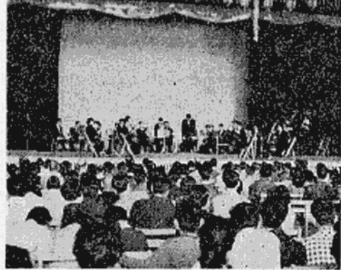
群馬交響楽団演奏

5月17日、18日の春の東照宮大祭は快晴に恵まれ、行事のすべてを、とどろおろしく終了した。写真は国鉄駅広場からはじめられた「やぶさめ」行進、市役所前広場にて。