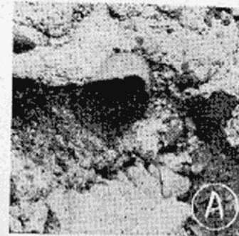
写真A 流失した鉄管の切口

今回断水の最大の原因は、なんと云っても安良沢裏見の水源地取水入口の直轄二百名の鉄管が流失してしまっただけに過ぎない。 早速カメラをかついで現場へ行ってみると、水は引いたものの五十米にわたって大きな鉄管が流失してしまっているのが驚く。写真Aがその流失した鉄管の切口だがこの鉄管は河床にうめてその上を厚いコンクリートで覆ってあったのだそう。それがコンクリートごと流されてしまっ